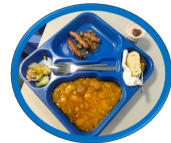
Sopa de verduras con pan aldeano